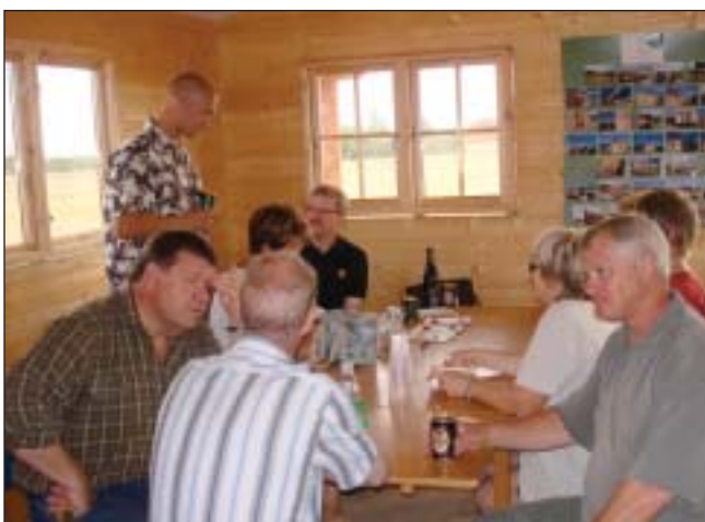
Snak mellem venner.