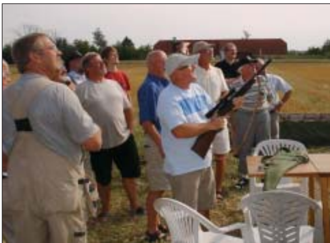
Klar til skud.