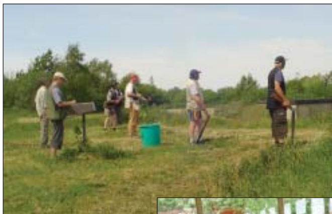
Klar på trapbanen.