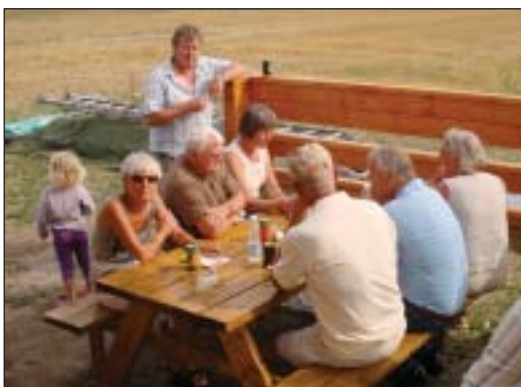
Hygge på terrassen.