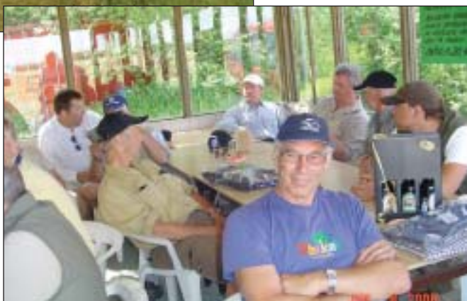
Næsten slut på besøget.