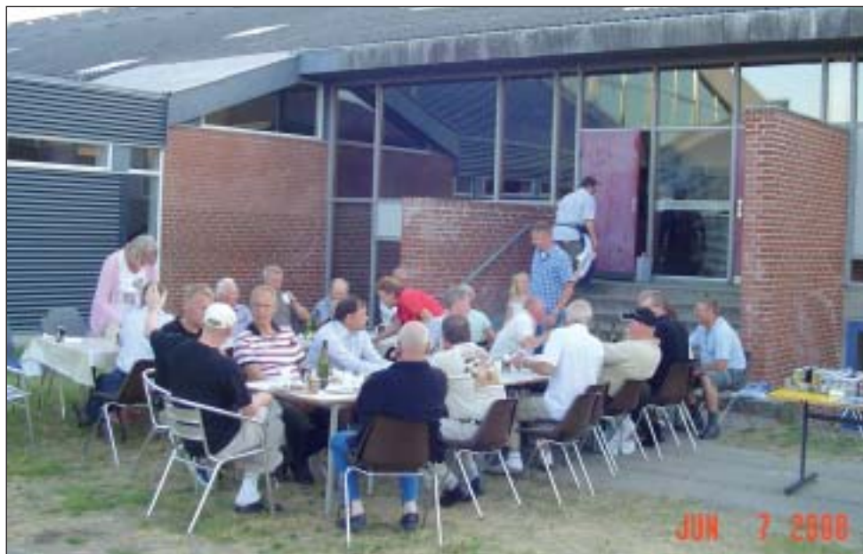
Hygge ved spisningen lørdag aften.

Her var der som vanligt godt gang i banerne, og konkurrence på duerne, den nye trap bane var også godt