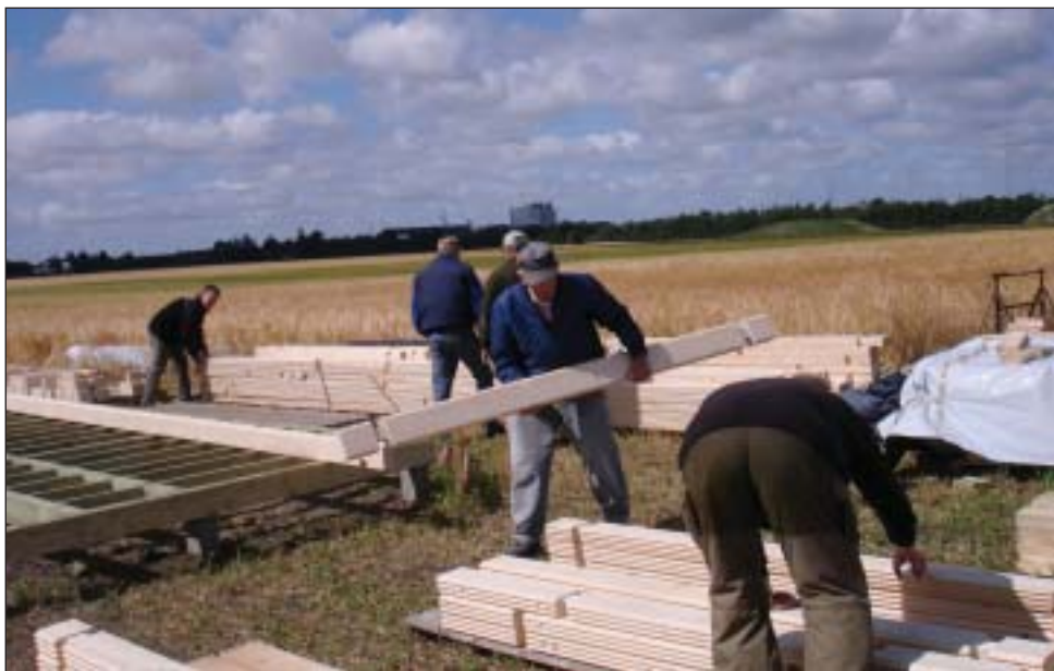
Øverst: Så gik starten endelig. Nederst: Travlhed på byggepladsen.