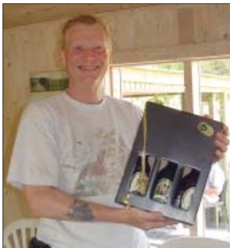
God øl som præmie.