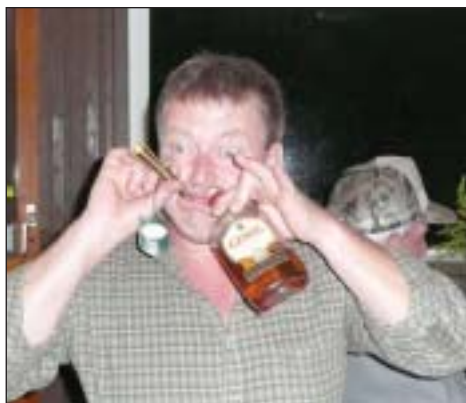
Man kan ikke drikke...