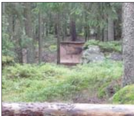
En post på feltbanen.