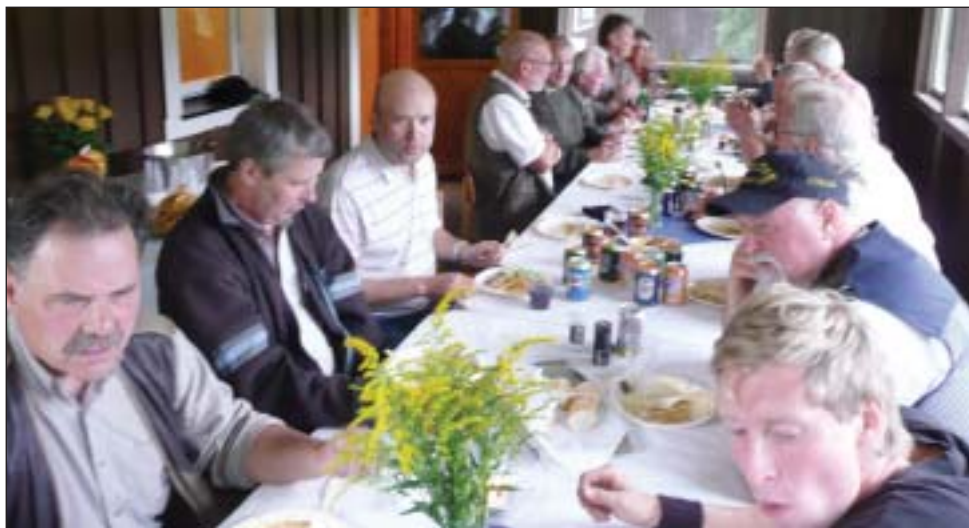
Hygge ved bordet.

Søndagen oprandt, og vi skulle i gang med jagstien. Vejret var ikke helt med os, det regnede lidt. Første post var en elgkalv der skulle skydes til. Anden post var en elgtyr, her var skiven lidt større. Den næste post var en buk der stod meget lavt, så vi skulle skyde som om vi stod på en bakketop. Posten herefter var et vildsvin og posten derefter var 2 bjørne, hvor