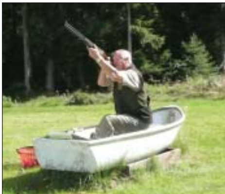
Bent i fin stil.

Nu var det endelig tid til at få brændt lidt krudt af. Vi mødtes på Elgbanen og gjorde os klar. 7 mand kom på listen og en efter en blev vi lukket ind og fik skudt. Der var spænding hver gang en havde skudt en god serie, kunne han gøre det igen, og måske opnå et mærke. Jeg tror alle var tilfredse og nu ventede vi på at svenskerne skulle skyde, så der kunne blive lidt konkurrence. Da de var færdige med at skyde, fik vi mulighed for