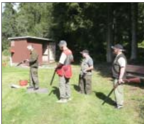
Kø ved duerne.

Om aftenen var der grillede koteletter med tilbehør samt øl og vin. Der var en livlig snak med svenskerne, og vi havde en meget hyggelig aften.