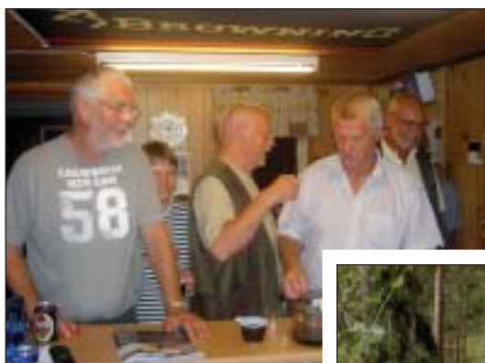
Hygge ved aftenkaffen