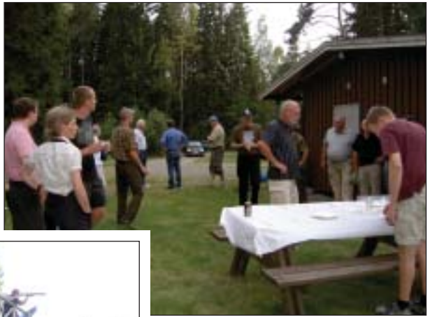
Skål og tak for 30 år