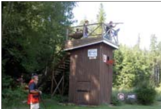
Skeet fra taget