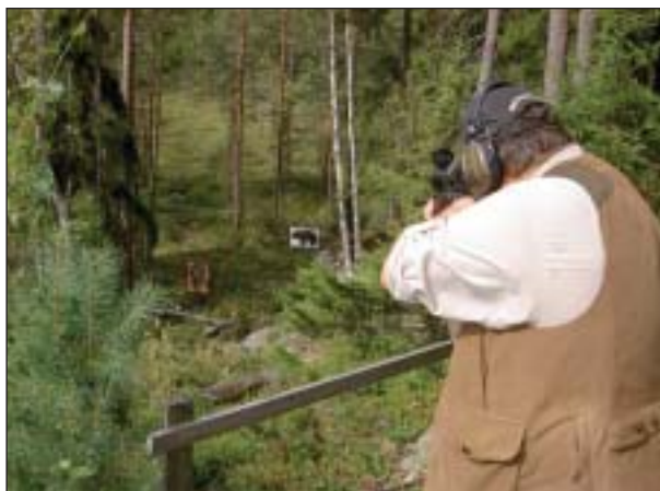
Jagsti med riffel