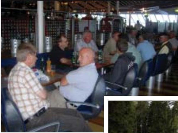
Hygge på færgen