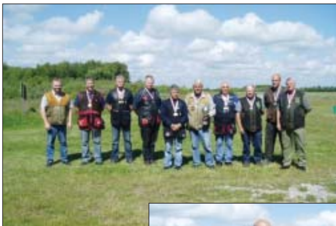
De tre vinderhold.