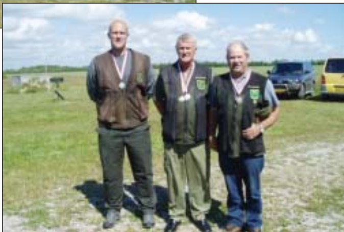
Tillykke med sølvet!