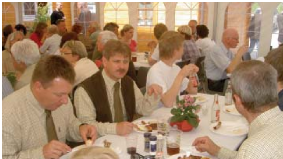
Der hygges i teltet.