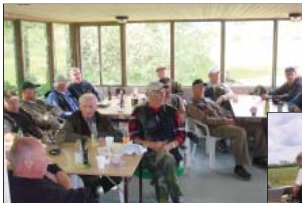
Samling inden hjemrejse.