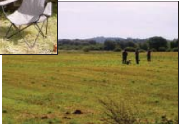
Kaj får information ved duerne.