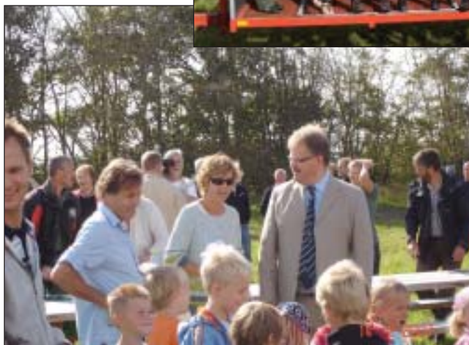
Borgmesteren i samtale.