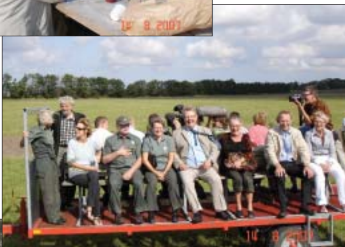
Klar til køreturen.