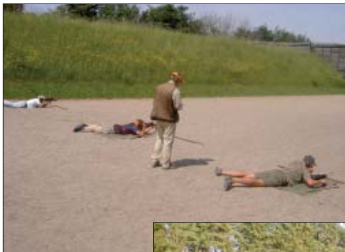
Konkurrencen er godt i gang.