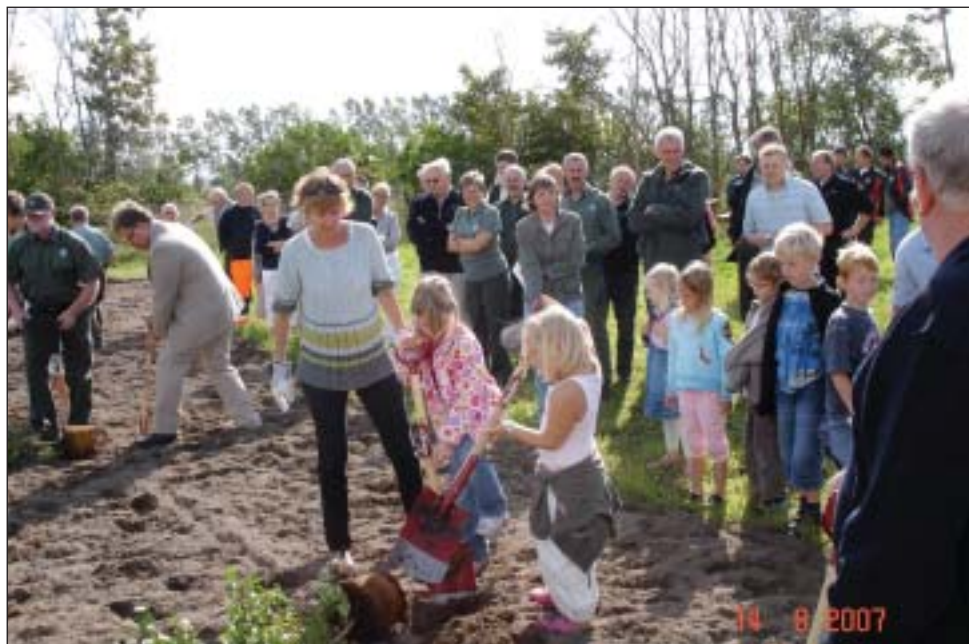
Der plantes buske.