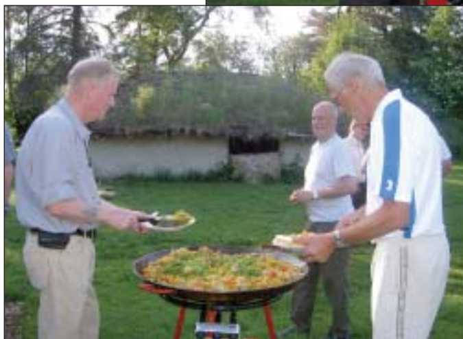
Så er der Paella og godt vejr til alle!