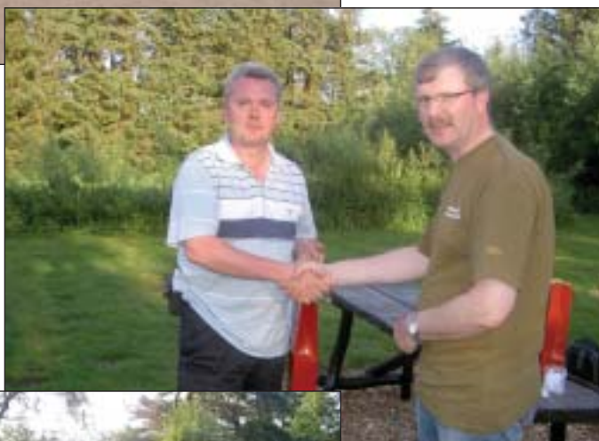
Tillykke med det fine resultat.