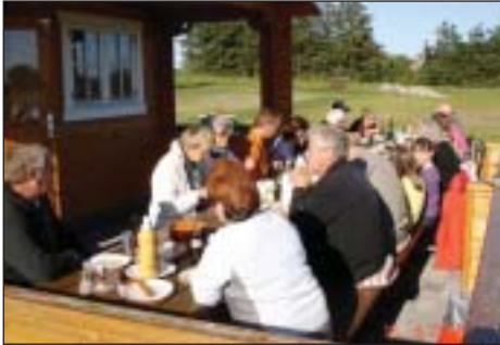
Der hygges ved bordet.